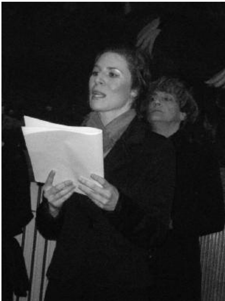
Sopra, una delle interpreti del reading