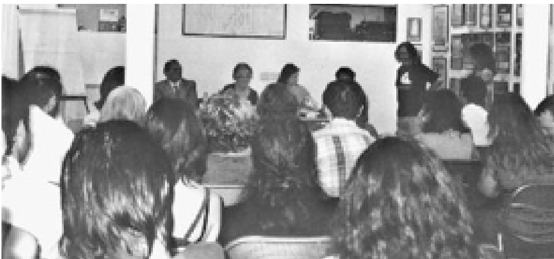
La libreria dove si è svolta la premiazione