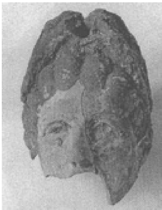
Anfora, concubina pettinata a forma di anfora

Si assiste inizialmente agli eccessi di Charisio , disperato perché la sua adorata moglie Panfile lo ha sposato mentre era incinta di un altro uomo. Il figlio della colpa, nato durante un'assenza di Charisio che nulla sospetta, viene esposto con un piccolo corredo di gioielli che possono aiutare un giorno a riconoscerlo. Un servo però rivela questa nascita a Charisio, che subito abbandona la moglie, ma si fa ospitare nella casa di fronte da un amico, un ex soldato, che gli cede per soldi la sua schiava Abròtono , una citarista. Charisio in realtà nemmeno la tocca, tanto è preso da opposti sentimenti per la moglie che crede infedele. Un pastore trova un bambino con un piccolo corredo di gioielli. Lo cede successivamente a un carbonaio, ma vorrebbe tenere i gioielli per sé. Ne nasce una disputa che viene arbitrata - in favore del carbonaio - da un passante, Smicrìne , il padre di